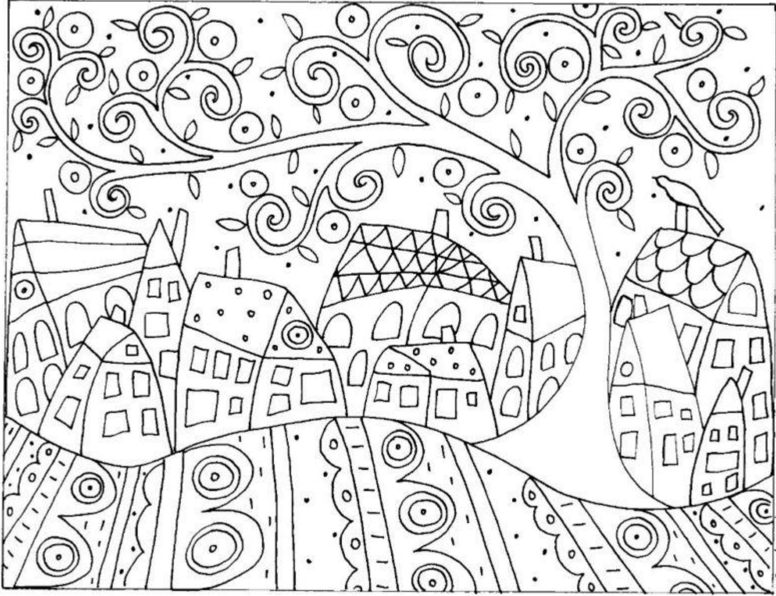
Bird 10 Houses & A Swirl Tree 2/22/10 © Karlagerard