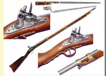
L'Artillerie à pied de la Ligne