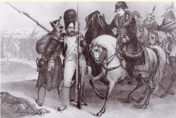
Napoleon remettant sa pelisse à un grognard de la Grande Armée

Ses soldats étaient surnommés LES GROGNARDS