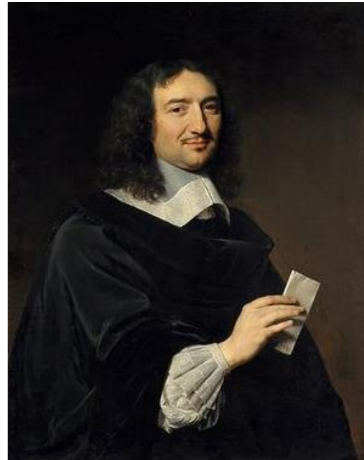
Colbert en 1655

Colbert laisse l'image d'un excellent gestionnaire , même si les résultats économiques du règne peuvent paraître très discutables en raison des fortes ponctions causées par les dépenses militaires, les constructions et les largesses du roi. Il ne faut pas oublier que Louis XIV a encore régné 32 ans après la mort de Colbert : tant que le ministre fut aux affaires, les budgets ont été à peu près maîtrisés ; les déficits ne cessent de s'accumuler après lui .