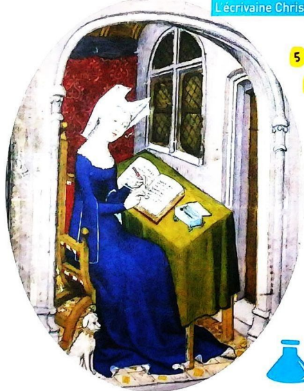
L'écrivaine Christine de Pisan au XV e siècle