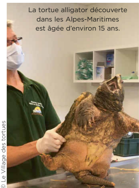
La tortue alligator découverte dans les Alpes-Maritimes est âgée d'environ 15 ans.

« Ces mesures me rassurent. Je trouve ça normal de ne plus trop se rapprocher des copains : il y a un risque. »