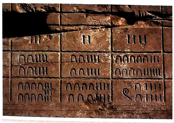
Temple d'Amon à Karnak, en Égypte

8 ✳ À l'époque des pharaons (3 000 ans avant J.-C.), les Égyptiens utilisaient des hiéroglyphes pour désigner les nombres.