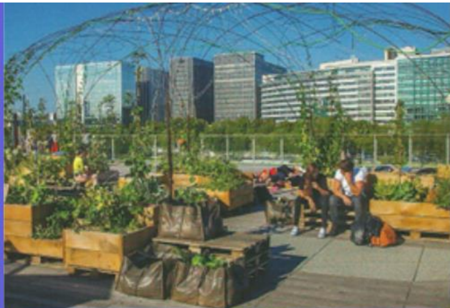
Un exemple de toit et végétalisés