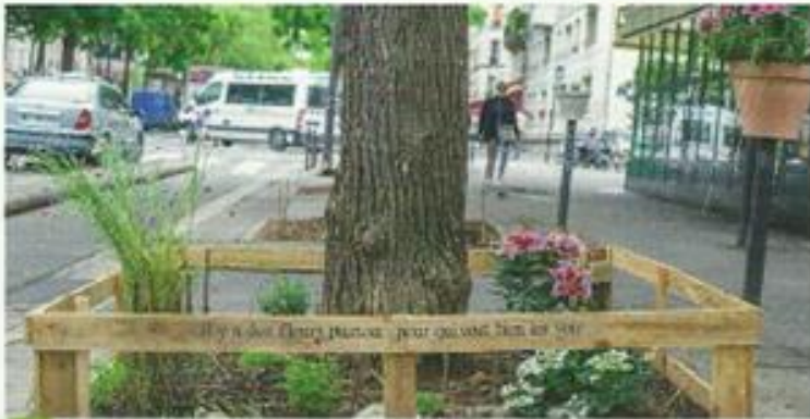
3 Des mini-jardins au pied des arbres