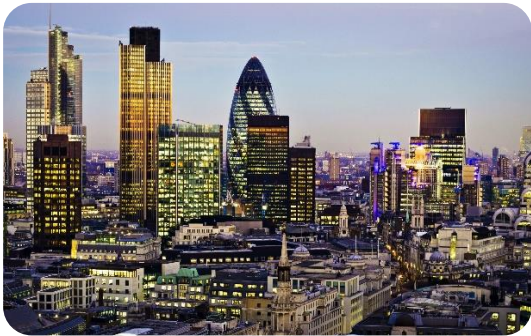
Londres, quartier de la City