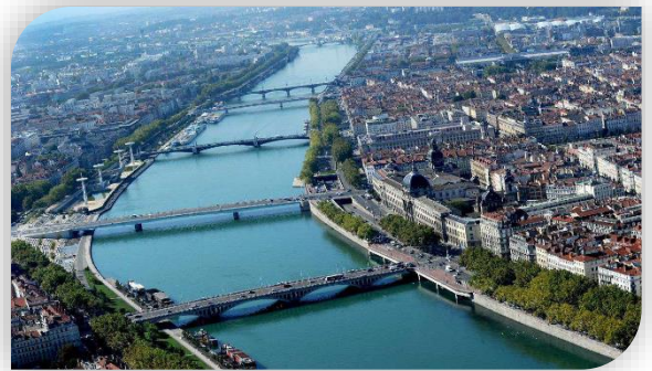
Lyon, métropole régionale

Toulouse, Nice, Bordeaux, Nantes, Dijon sont aussi des métropoles régionales françaises.