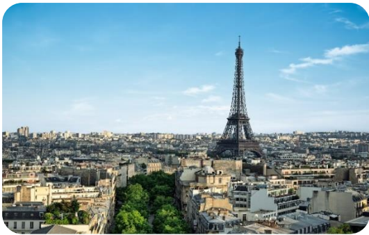
Paris, vue sur la Tour Eiffel