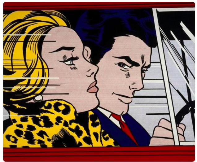
In the car , Roy Lichtenstein, 1963