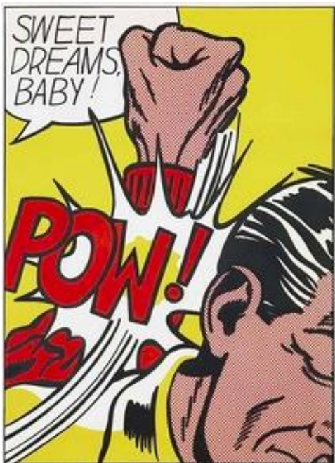
Sweet dreams baby , Roy Lichtenstein, 1965