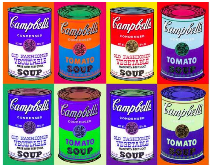
Les sops Campbell de Andy Warhol