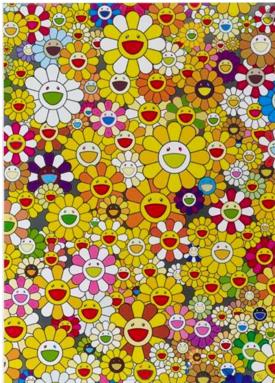
Homage to mongold, Takashi Murakami

Maintenant que vous avez un aperçu des œuvres de cet artiste, je vous propose de vous inspirer de ces toiles et de réaliser vous-même à la maison des fleurs colorées, que nous assemblerons tous ensemble en classe afin de former une fresque monumentale.