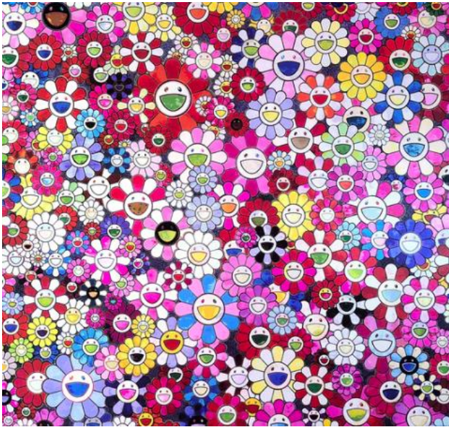
Shangri-la Shangri-la Shangri-la Pink, Takashi Murakami

J'aimerais que nous réalisions ensemble une fresque Pop Art à la manière de Takashi Murakami. Je vous mets des photos des œuvres de cet artiste japonais qui s'illustre dans le domaine du Pop Art. Il crée des sculptures monumentales, peintures, papiers peints, et autres objets. Ses œuvres puisent directement dans l'imagerie du manga japonais.