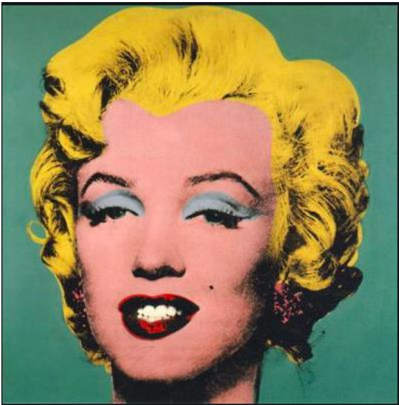
Turquoise Marilyn d'Andy Warhol, 1964

Voici quelques représentations Pop Art que vous pourriez déjà connaître :