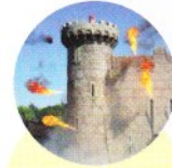
2 Le Puy du Fou 1,9 million