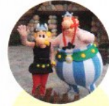
3 Le Parc Astérix 1,8 million