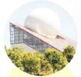
4 Le Futuroscope 1,7 million