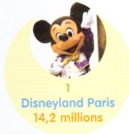
1 Disneyland Paris 14,2 millions

La France compte environ 200 parcs de loisirs. Parmi eux, on distingue les parcs d'attractions de pur divertissement (comme Disneyland, le Parc Astérix ou Walibi), les parcs à thème à vocation culturelle ou éducative (comme le Futuroscope, le Puy du Fou, Vulcania, la Cité de l'espace) et les aquariums et parcs animaliers comme Océanopolis, Marineland, le zoo de Vincennes.