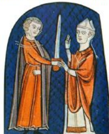
Le sacre du roi de France (Ordre de la consécration et du couronnement des rois de France, manuscrit, 1280).